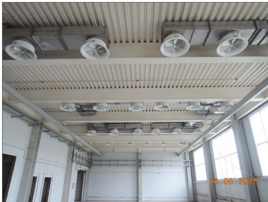
По первоначальному проекту

Кировский ракетный завод, г. Киров. Участок сборки моноблоков