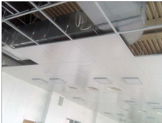
По проектной документации ООО «МЗМО»